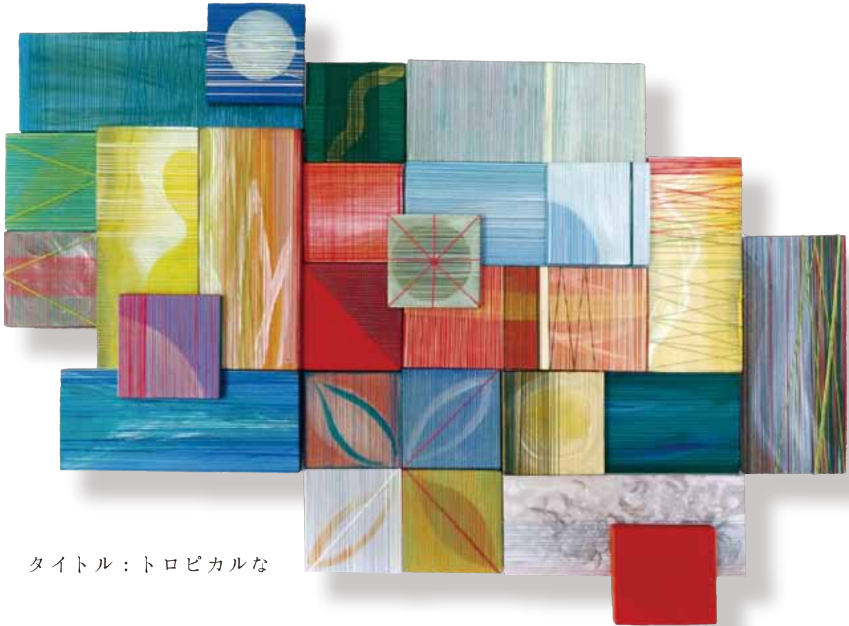
タイトル：トロピカルな